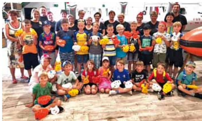
Die Hortkinder der Kita Regenbogen

Unser herzlicher Dank gilt der Firma Texcon für den interessanten Einblick in ihre Arbeit und die wundervolle Betreuung. Wir alle waren sehr begeistert und freuen uns auf die weitere Zusammenarbeit.