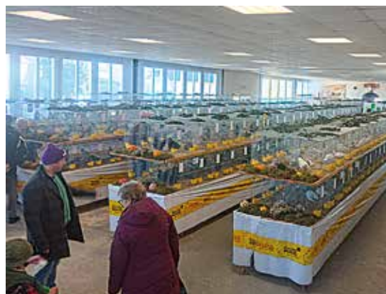
Blick in die große Ausstellungshalle