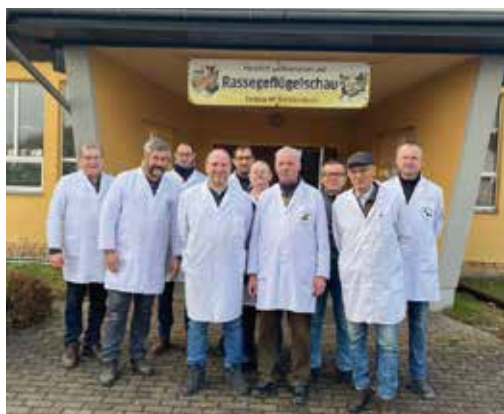
9 Preisrichter mit Ausstellungsleiter