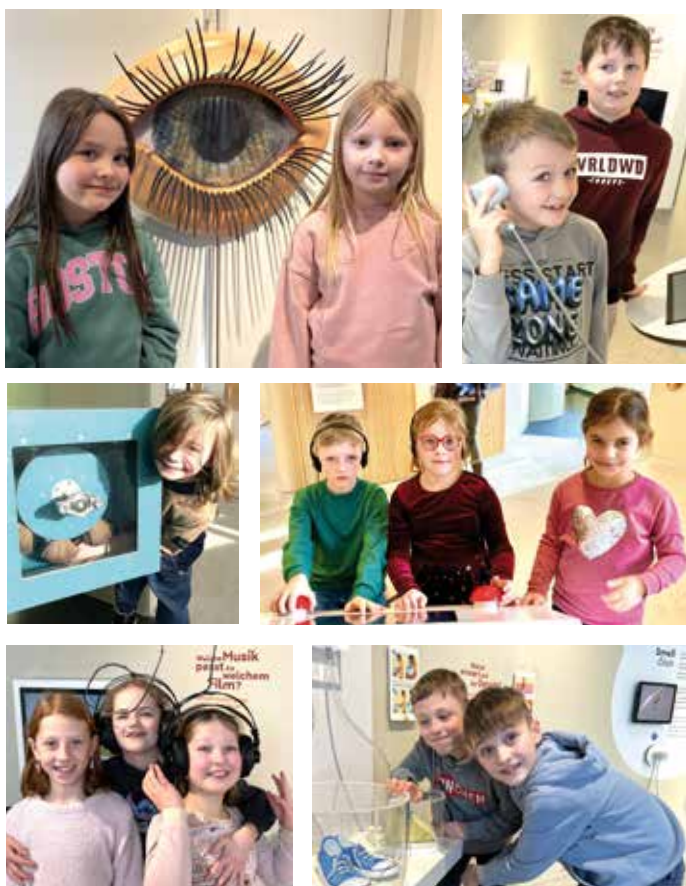
Die Schülerinnen und Schüler der Klasse Flex 1 aus der Grundschule Ortrand

Ein absolutes Highlight war das Spiegelkabinett. Es war so verwirrend und gleichzeitig faszinierend, sich selbst in unzähligen Spiegeln zu sehen. Ebenso aufregend war der Tasttunnel, in dem wir im Dunkeln verschiedene Oberflächen und Materialien ertasten mussten. Am Ende des Tages waren wir alle begeistert von den vielen Eindrücken und Erlebnissen, die wir gesammelt hatten. Der Ausflug ins Hygienemuseum war nicht nur informativ, sondern auch ein großer Spaß. Es war der perfekte Ausklang des ersten Schulhalbjahres vor den wohlverdienten Winterferien.