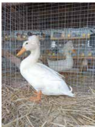
Landente mit Haube